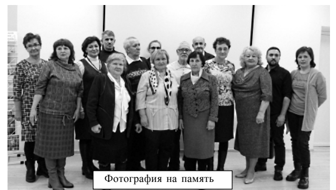
Фотография на память