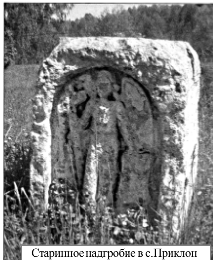
Старинное надгробие в с. Приклон

2022 год ушел в прошлое. По-разному он сложился для жителей Меленковского района. У кого-то было много счастливых моментов. У кого-то складывались непредвиденные ситуации. Возможно, они и сохраняются в памяти у этих людей. Но я уверена, что ненадолго. А вот что, несомненно, и спустя годы все мы будем вспоминать, так это начало проведения специальной военной операции на Украине. Ведь уже 82 года прошло после начала Великой Отечественной войны, а наш народ все продолжает возвращаться к годам борьбы с немецко-фашистским захватчиком. Наши предки, жившие 100-150 лет назад, не забывали боевых событий борьбы с наполеоновской армией, хотя им не довелось пережить тех ужасов, с которыми столкнулись деды и прадеды, но они помнили их заветы и тех, кто храбро сражался с врагом. Вспомним и мы этих людей, тем более, что в ушедшем году исполнилось 210 лет с начала Отечественной войны 1812 года.