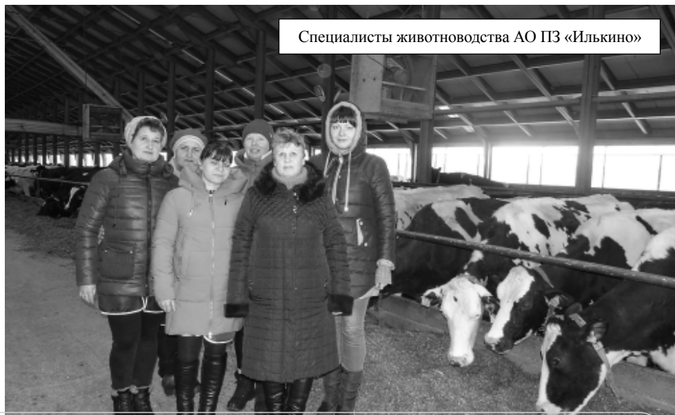
Специалисты животноводства АО ПЗ «Илькино»