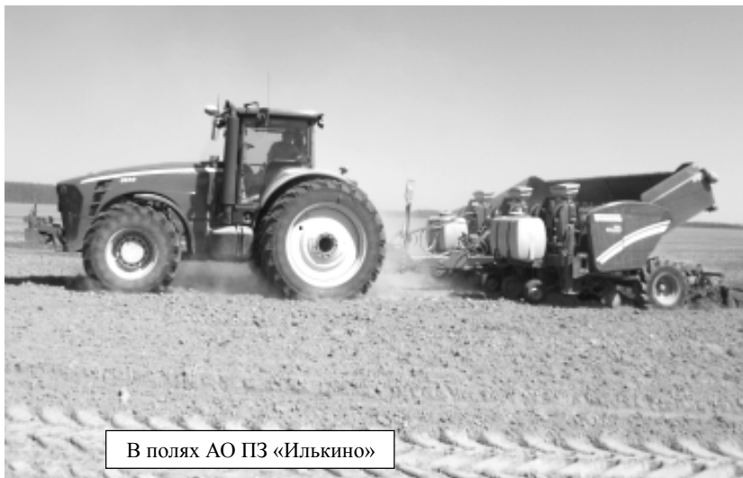
В полях АО ПЗ «Илькино»

«Не радуется в этом месяце погода», - слышишь подобные разговоры между жителями нашего города, у которых начался дачный сезон. Как уверяют, в огородах им столько всего нужно сделать, что просто голова идет кругом, а тут еще дожди зарядили. Поэтому приходится откладывать столь важные дела.