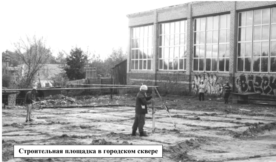
Строительная площадка в городском сквере

Строительство такого сложного объекта потребовало выполнения ряда дополнительных работ, например, обустройство подъезда к стройплощадке. На настоящий момент работники организации подрядчика ООО «СтройТайм плюс» занимаются подготовкой площадки, выполнен демонтаж старого здания и ограждений, идет выравнивание и разметка территории. Металлоконструкции для здания эстрады находятся в стадии изготовления. Стоимость возведения объекта со всеми