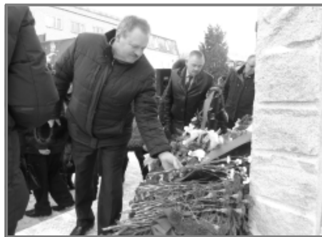
за пределами Отечества. В торжественной церемонии