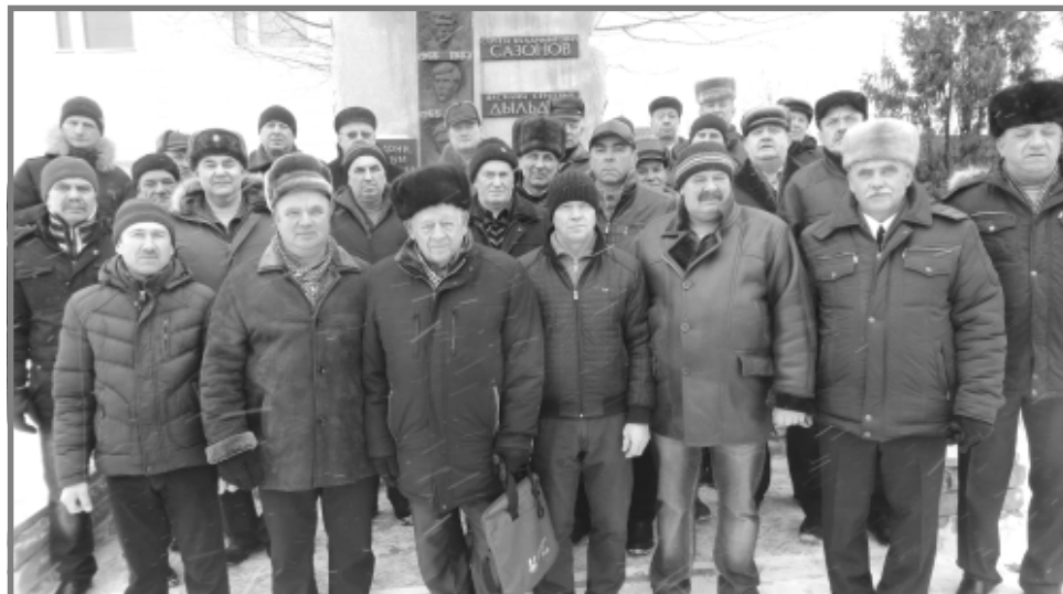
монии приняли участие глава администрации района

15 февраля в г. Меленки у памятника воинам, погибшим в Афганистане при выполнении своего интернационального воинского долга, традиционно прошел торжественный митинг, посвященный Дню памяти о россиянах, исполнявших служебный долг