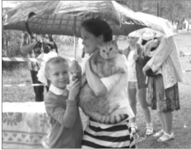
(Окончание. Нач. на 1 стр.)

Победители по номинациям получили солидные «кошачьи» призы, а все остальные хозяева — подарки, которые обязательно пригодятся в уходе за своими очаровательными питомцами.